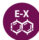
Е-Х ДІОКСИД СІРКИ ТА СУЛЬФІТИ