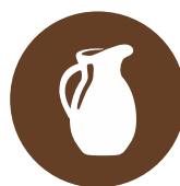
МОЛОКО ТА МОЛОЧНІ ПРОДУКТИ