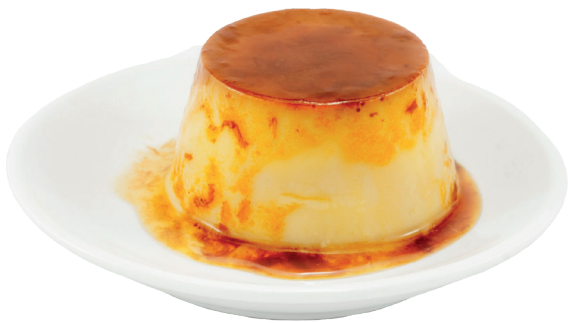
Домашній флан 4,20€